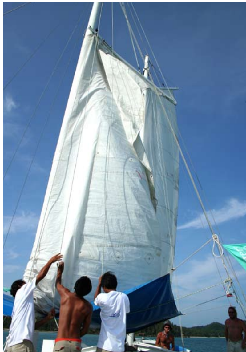
A Gulf Charters crew will help set the sails for less experienced sailors

คุณฟิลพาเราลงเรือยอชท์ขนาด 32 ฟุต แล้วมุ่งหน้าลงทางใต้ เช้าวันรุ่งขึ้นเราก็มาถึงเกาะเล็กๆในหมู่เกาะรัง น้ำทะเลใสเสียจนเรามองเห็นสมอเรือปักลงในหินทรายที่อยู่ต่ำลงไปใต้น้ำกว่า 8 เมตร เราลุยน้ำสู่เกาะฝากรอยเท้าไว้บนหินทรายขาว จากนั้นก็ดำน้ำ เวชชมหินปะการังสีม่วงสดและปลาเลือดดาวแอบซ่อนตามกิ่งปะการัง ก่อนกลับสู่เรือ